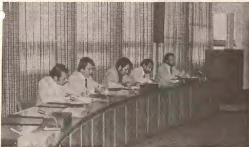
Representantenan di gobierno insular den reunion cu Gobierno Central tocante Arumincó.

Teniendo na cuenta cu e dos pilarnan di e economia di Aruba, esta turismo y Lago, no ta suficiente pa e isla sigul progresa, Gobierno Insular ta haciendo tur posible pa diversifica e economia Arubano.